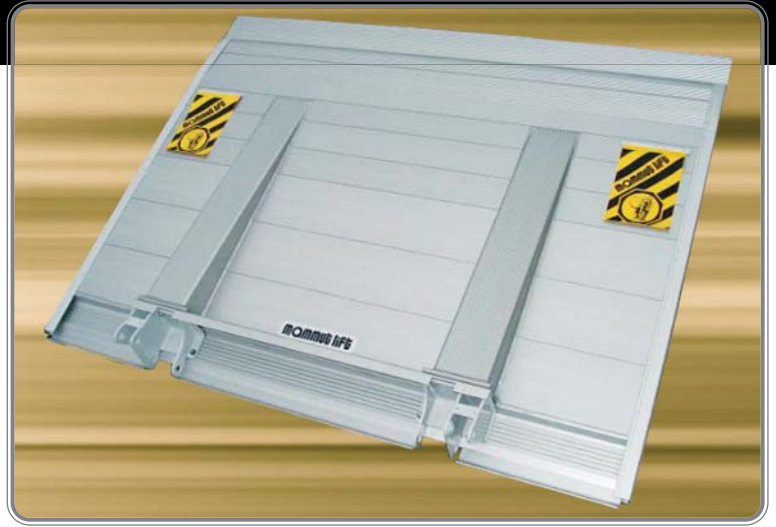
PLATE-FORME ALUMINIUM PLANE