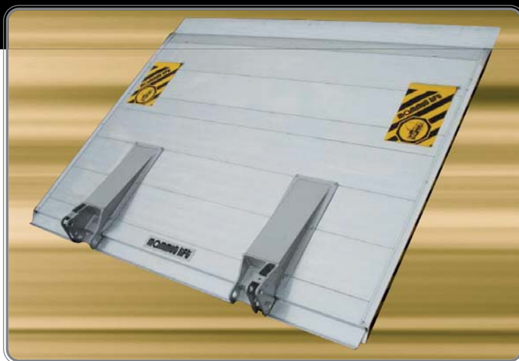
PLATE-FORME ALUMINIUM PLANE